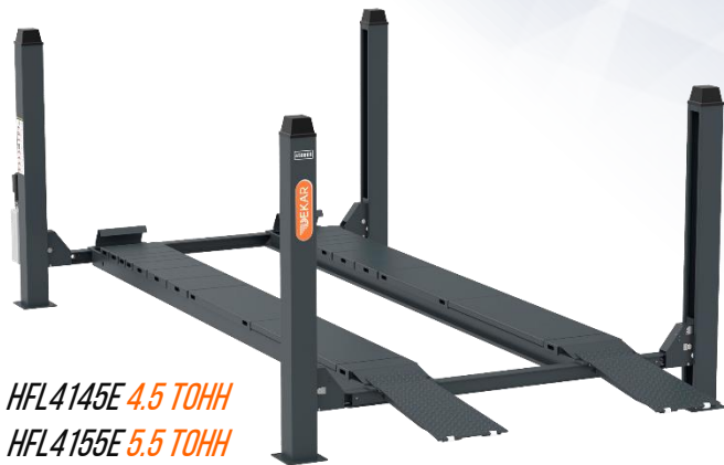
HFL4145E 4.5 ТОНН HFL4155E 5.5 ТОНН