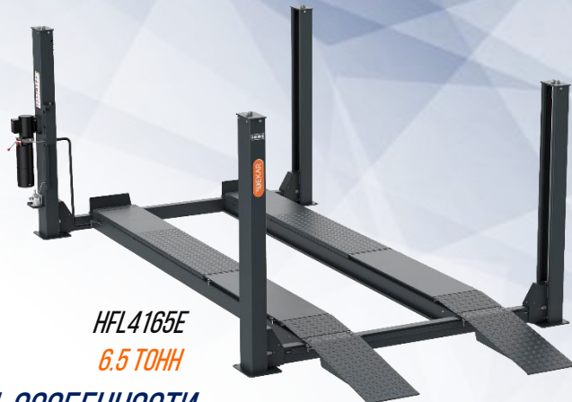
HFL4165E 6.5 ТОНН